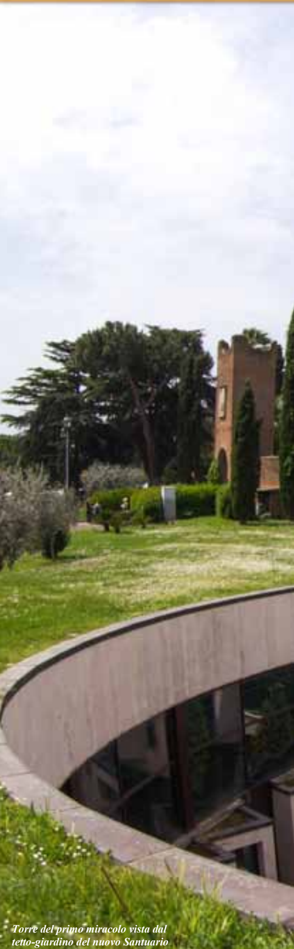
Torre del primo miracolo vista dal tetto-giardino del nuovo Santuario

Via del Santuario, 10 (Km 12 della Via Ardeatina) - 00134 Roma - Italy