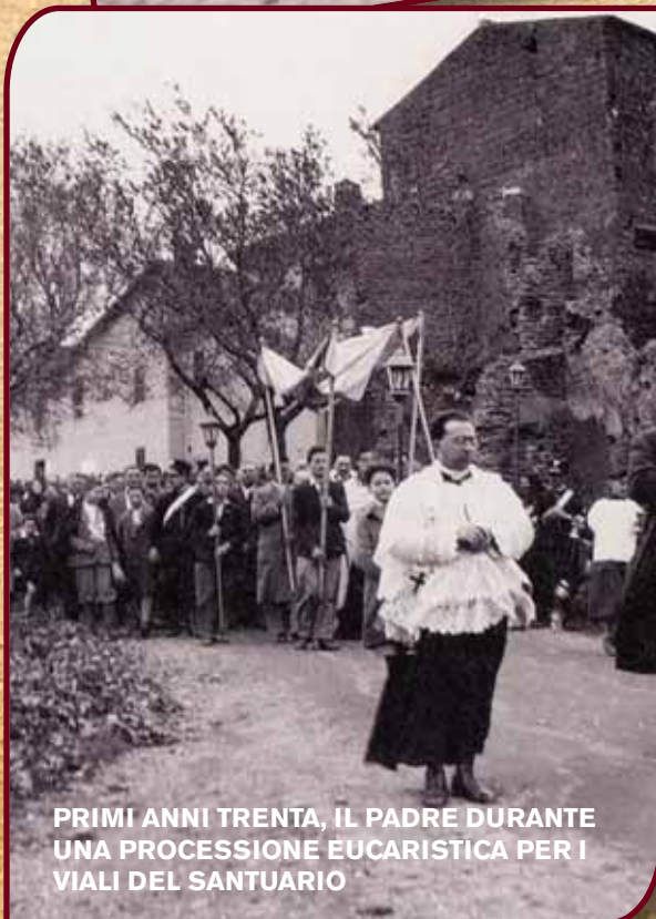
PRIMI ANNI TRENTA, IL PADRE DURANTE UNA PROCESSIONE EUCARISTICA PER I VIALI DEL SANTUARIO