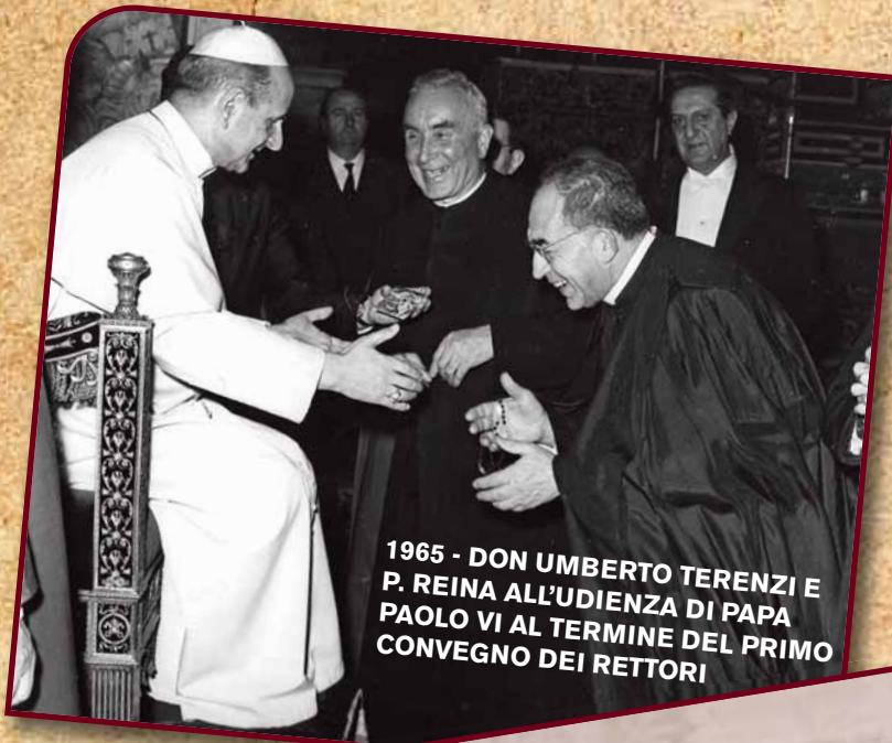
1965 - DON UMBERTO TEREZI E P. REINA ALL'UDIENZA DI PAPA PAOLO VI AL TERMINE DEL PRIMO CONVEGNO DEI RETTORI