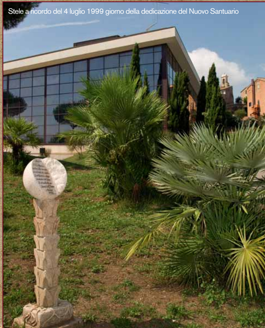
Stele a ricordo del 4 luglio 1999 giorno della dedicazione del Nuovo Santuario