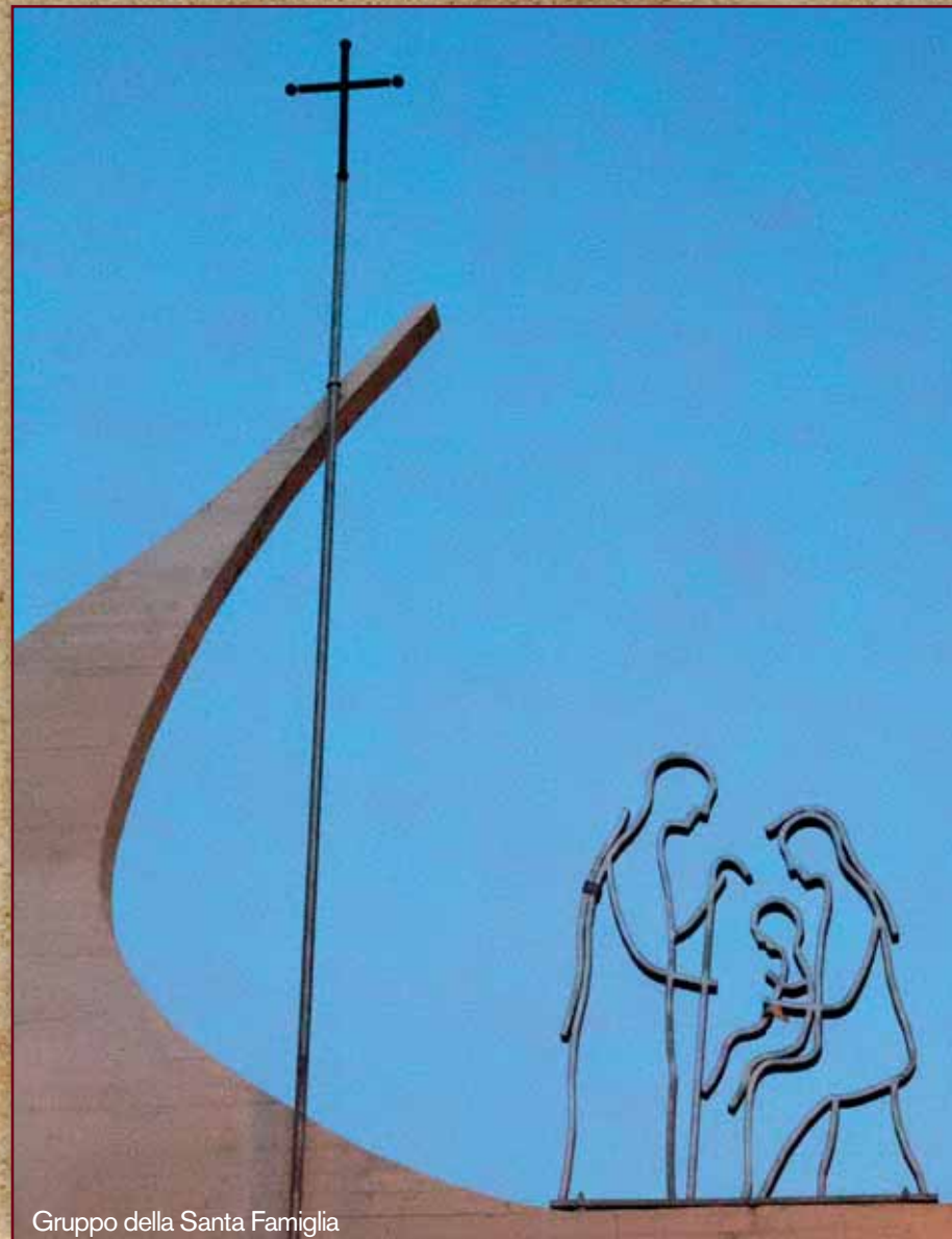
Gruppo della Santa Famiglia