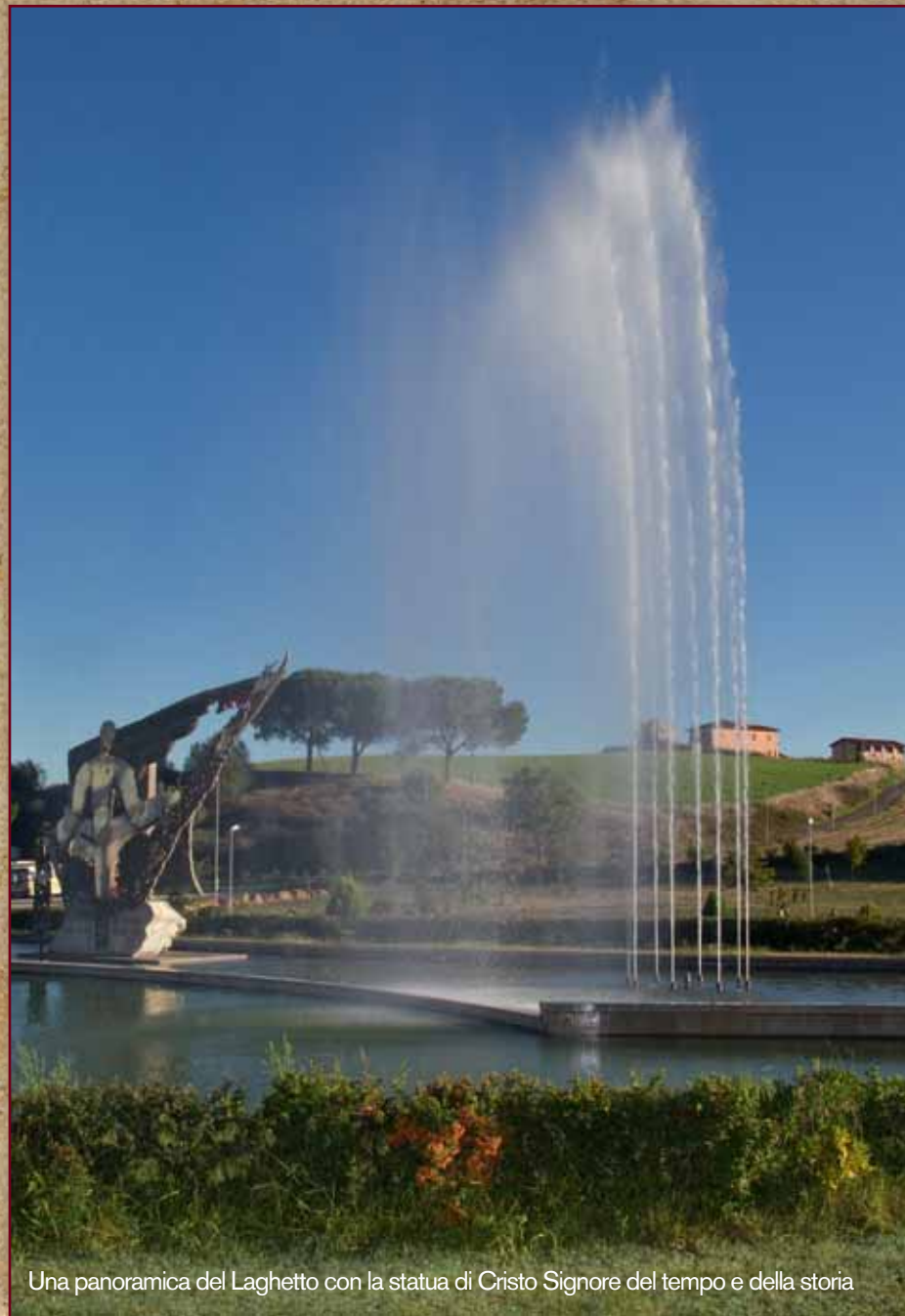
Una panoramica del Laghetto con la statua di Cristo Signore del tempo e della storia