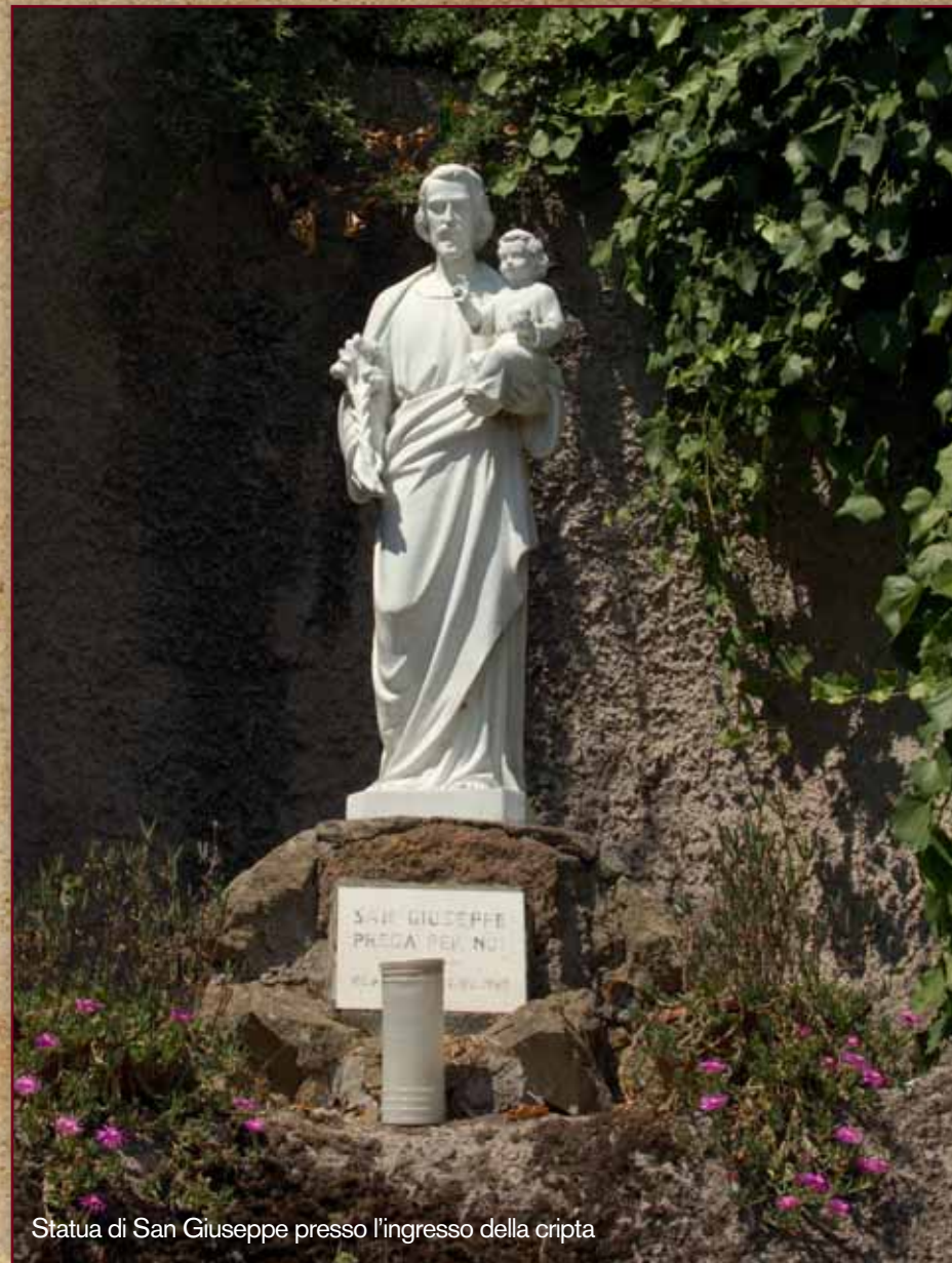
Statua di San Giuseppe presso l'ingresso della cripta