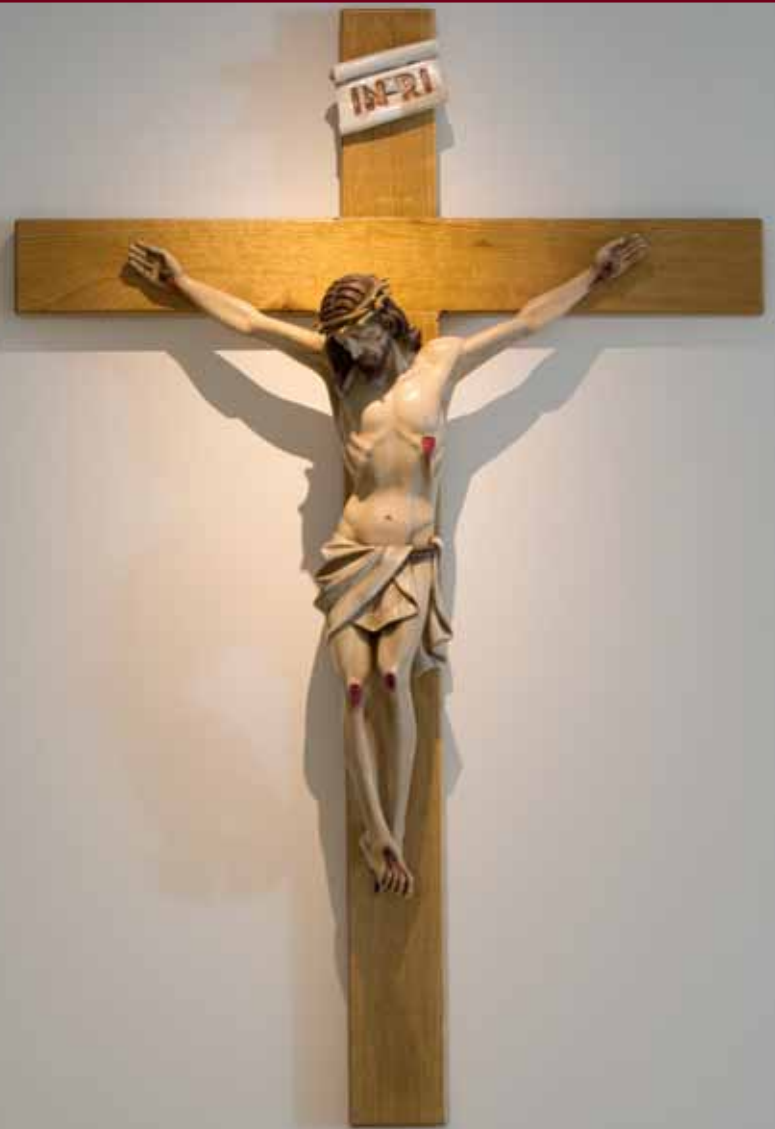
Crocifisso della Cappella del Seminario della Madonna del Divino Amore