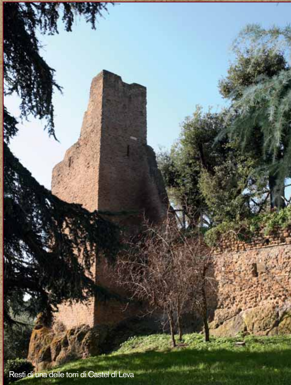
Resti di una delle torri di Castel di Leva