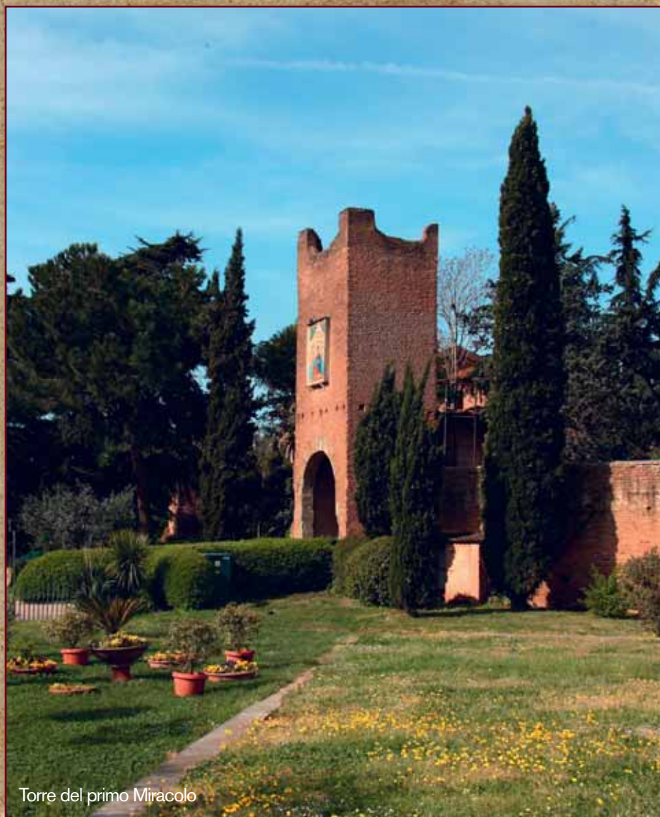
Torre del primo Miracolo