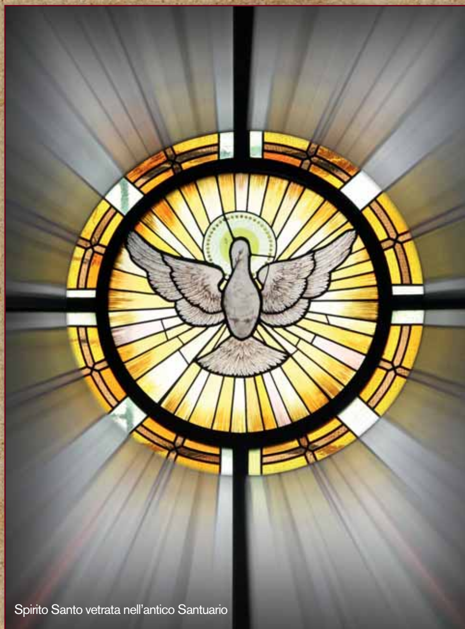
Spirito Santo vetrata nell'antico Santuario