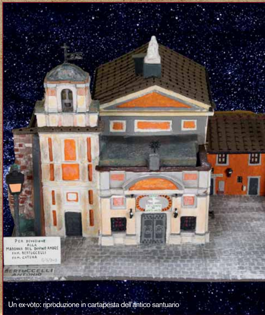
Un ex-voto: riproduzione in cartapesta dell'antico santuario