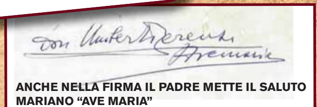
ANCHE NELLA FIRMA IL PADRE METTE IL SALUTO MARIANO "AVE MARIA"