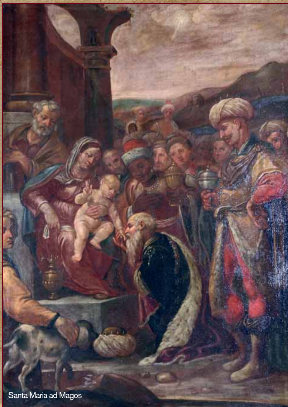
Santa Maria ad Magos

Dio ha varcato il suo Cielo e si è chinato sull'uomo; ha stretto alleanza con lui entrando nella storia di un popolo; Egli è il re che è sceso in questa povera provincia che è la terra e ha fatto dono a noi della sua visita assumendo la nostra carne, diventando uomo come noi... Dio non si è tolto dal mondo, non è assente, non ci ha abbandonato a noi stessi, ma ci viene incontro in diversi modi, che dobbiamo imparare a discernere. E noi con la nostra fede, la nostra speranza e la nostra carità, siamo chiamati ogni giorno a scorgere e a testimoniare questa presenza nel mondo ... e a far risplendere nella nostra vita la luce che ha illuminato la grotta di Betlemme.