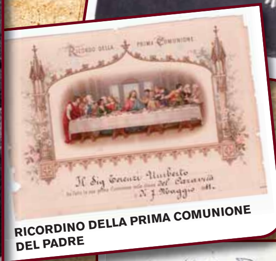
RICORDINO DELLA PRIMA COMUNIONE DEL PADRE