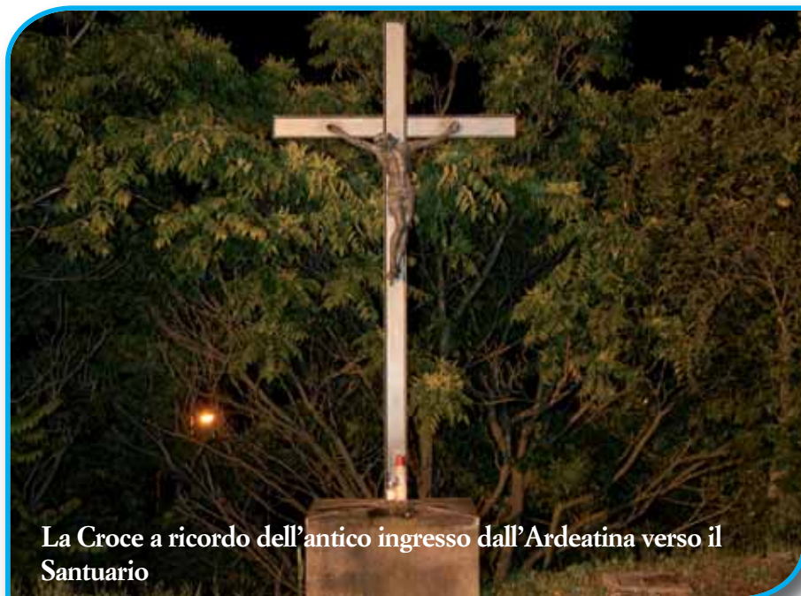
La Croce a ricordo dell'antico ingresso dall'Ardeatina verso il Santuario