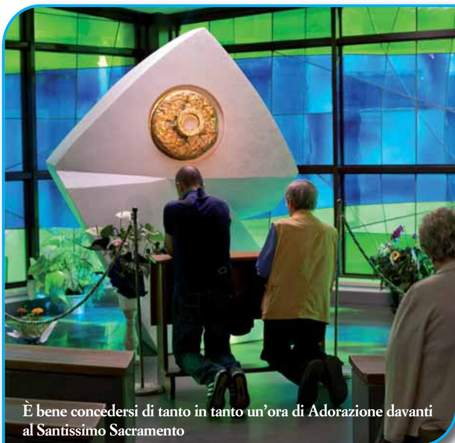
È bene concedersi di tanto in tanto un'ora di Adorazione davanti al Santissimo Sacramento

Per mezzo della morte che Cristo ha sofferto, Dio ha fatto pace anche con voi per farvi essere santi, innocenti e senza difetti di fronte a lui, perché rimaniate fermi nella fede, e non permettiate a nessuno di portarvi lontano da quella speranza che è vostra dal giorno in cui avete ascoltato l'annuncio del Vangelo.