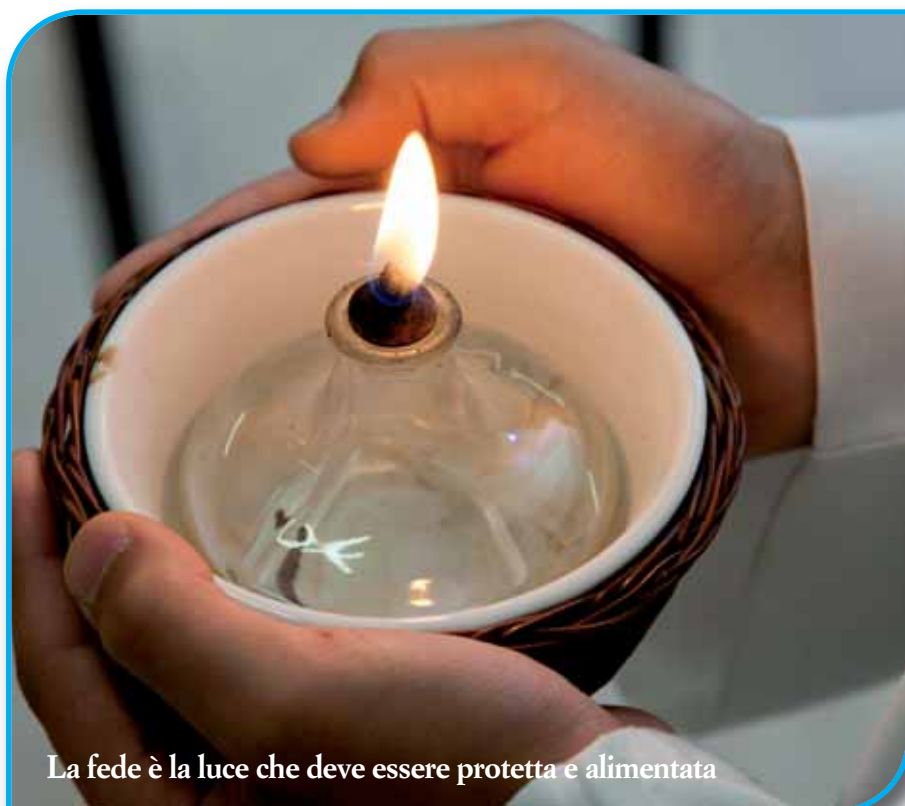
La fede è la luce che deve essere protetta e alimentata

Gesù raccontò una parabola ...: «C'era in città un giudice che non rispettava nessuno: né Dio né gli uomini. Nella città viveva anche una vedova. Essa andava sempre da quel giudice e gli chiedeva: Fammi giustizia contro il mio avversario. Per un pò di tempo il giudice non volle intervenire, ma alla fine pensò: «...Farò giustizia a questa vedova perché mi dà ai nervi...» Poi il Signore continuò: «Fate bene attenzione a ciò che ha detto quel giudice ingiusto. Se fa così lui, volete che Dio non faccia giustizia ai suoi figli che lo invocano giorno e notte? ... Ma quando il Figlio dell'uomo tornerà, troverà ancora la fede sulla terra?».