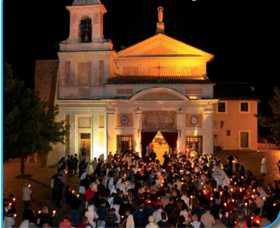
Conclusione della fiaccolata mariana all'ingresso del Santuario