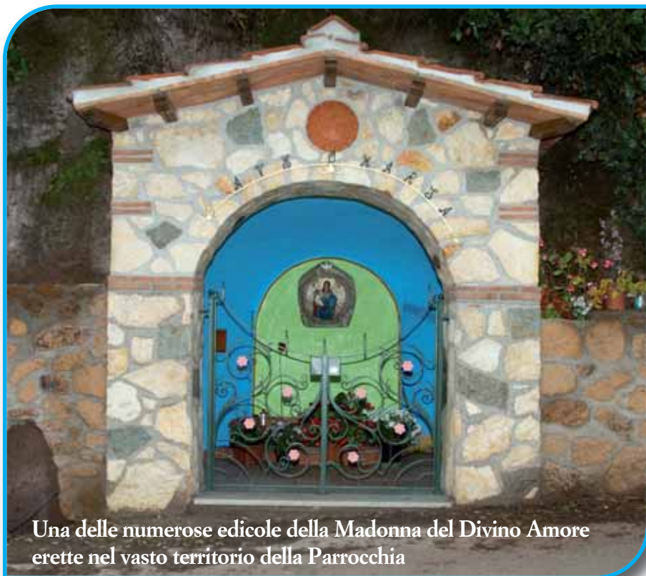
Una delle numerose edicole della Madonna del Divino Amore erette nel vasto territorio della Parrocchia