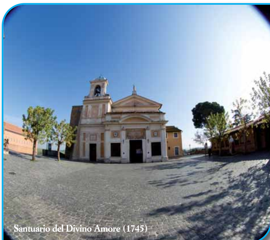
Santuario del Divino Amore (1745)

Quando vi abbiamo parlato di Gesù Cristo nostro Signore... non ci siamo serviti di storie inventate con astuzia. Noi abbiamo visto proprio con i nostri occhi... Inoltre abbiamo le parole dei profeti... sono come una lampada che brilla in un luogo oscuro, fino a quando non comincerà il giorno e la stella del mattino illuminerà i vostri cuori.