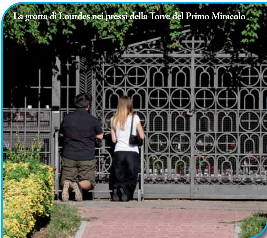
La grotta di Lourdes nei pressi della Torre del Primo Miracolo

... Allora disse all'albero: « Mai più in eterno nascano frutti da te! ». E l'albero immediatamente diventò secco. I Discepoli rimasero stupiti... Gesù rispose loro: «...Io vi assicuro che se avete fede e non dubitate, anche voi potete fare quello che è capitato a questo albero. Anzi potete dire a questa montagna: Sollevati e buttati nel mare! E avverrà così. Tutto quello che chiederete nella preghiera, se avete fede, lo riceverete».