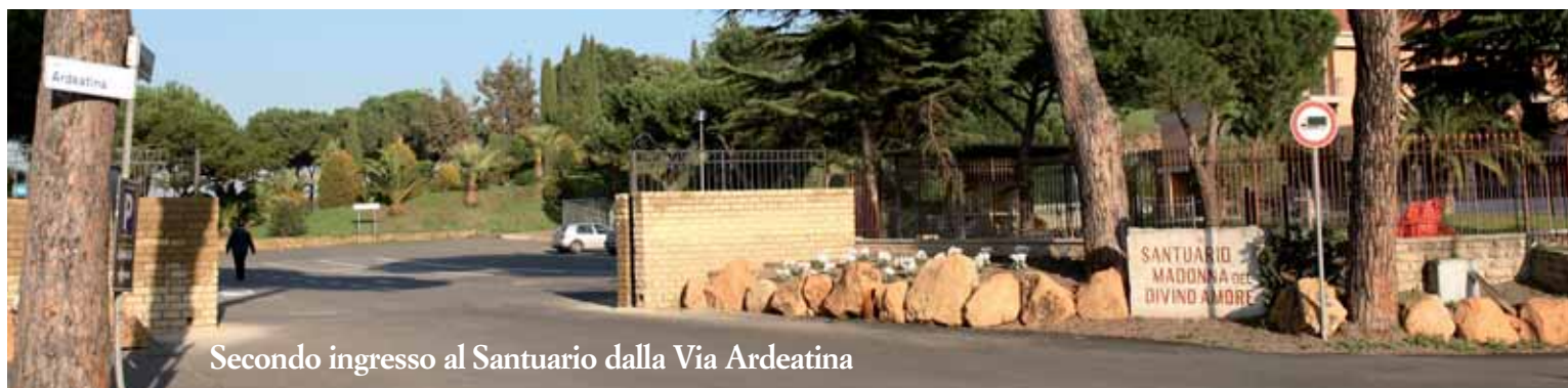
Secondo ingresso al Santuario dalla Via Ardeatina

Ogni sabato dal 1° dopo Pasqua all'ultimo di ottobre. Partenza ore 24 da Roma, piazza di Porta Capena, davanti alla FAO. Ore 5 della domenica arrivo e Santa Messa. Pellegrinaggi notturni straordinari: il 7 dicembre per l'Immacolata e il 14 agosto per l'Assunta.