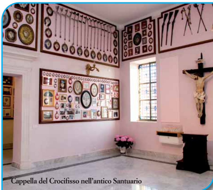
Cappella del Crocifisso nell'antico Santuario

Disse loro: «Supponiamo che uno di voi abbia un amico che a mezzanotte va da lui e gli dice: “Amico prestami tre pani perché è arrivato da me un amico ... e in casa non ho nulla...”. Supponiamo pure che quello dall'interno della sua casa gli risponda: “Non darmi fastidio: la porta di casa è già chiusa...”. Ebbene... : se quel tale non si alzerà a dargli il pane perché gli è amico, lo farà ... perché l'altro insiste. Perciò io vi dico: Chiedete e riceverete!... Bussate e la porta vi sarà aperta... »